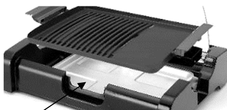
Vanička na masťotu

Rovná deska : Ideální pro pečení různých potravin včetně masa, vajec, slaniny, cibule, hub a rajčat.